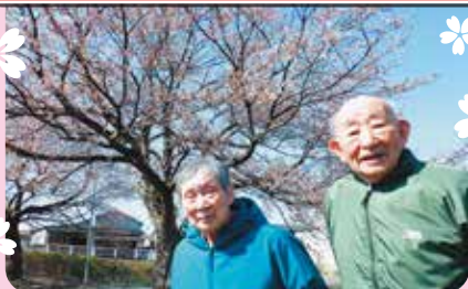
たちばな公園にてお花見