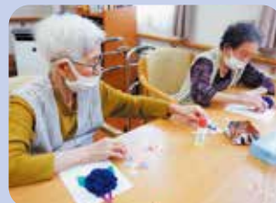
素敵なあじさいが完成！