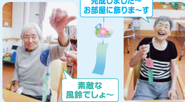
素敵な 風鈴でしょ～