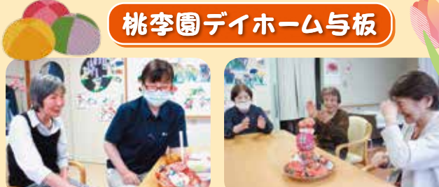
テーブルゲームも笑い声が絶えません