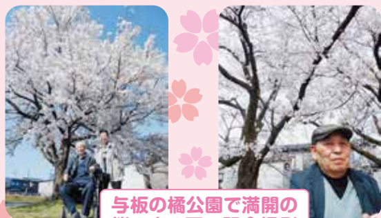
与板の橘公園で満開の桜の木の下で記念撮影