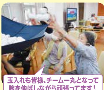
玉入れも皆様、チーム一丸となって腕を伸ばしながら頑張ってます!