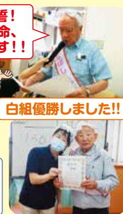
白組優勝しました!!