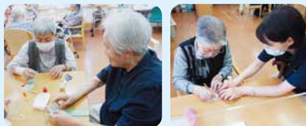
完成しました～ お部屋に飾りま～す