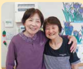
笑顔溢れる毎日です♪