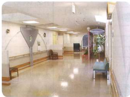
▲町並みをイメージしたフロア