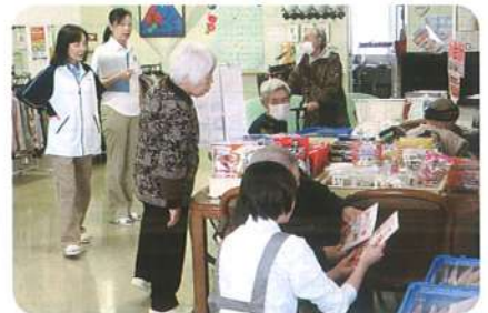
▲訪問販売会 …今日は何を買おうかな？