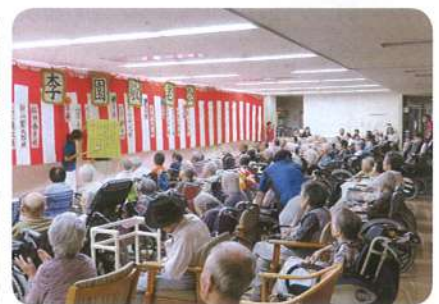
▲みんなでお祝いを