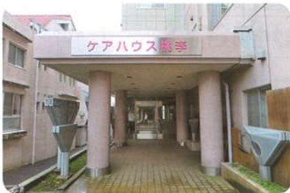
▲玄関のお化粧直しをしました (平成29年10月)